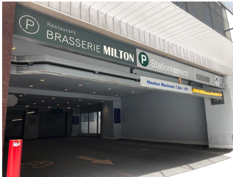
Illustration 9 - Parking de l'hôtel

Le paiement peut se faire dans le lobby, la machine se situe en face de l'ascenseur et est accessible.