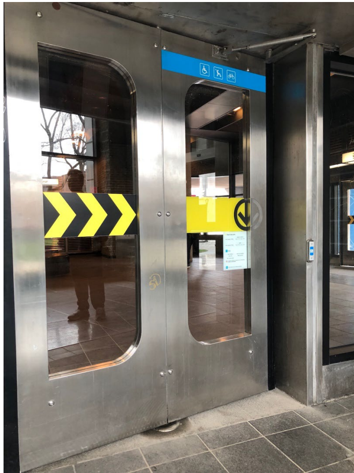
Illustration 5 - Portes du métro, avec indication fauteuil roulant