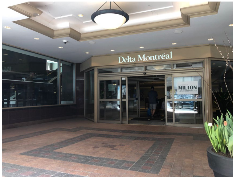
Illustration 11 - Entrée principale de l'hôtel

Le tapis dans l'entrée n'est pas trop épais. L'indication du comptoir d'enregistrement est claire.