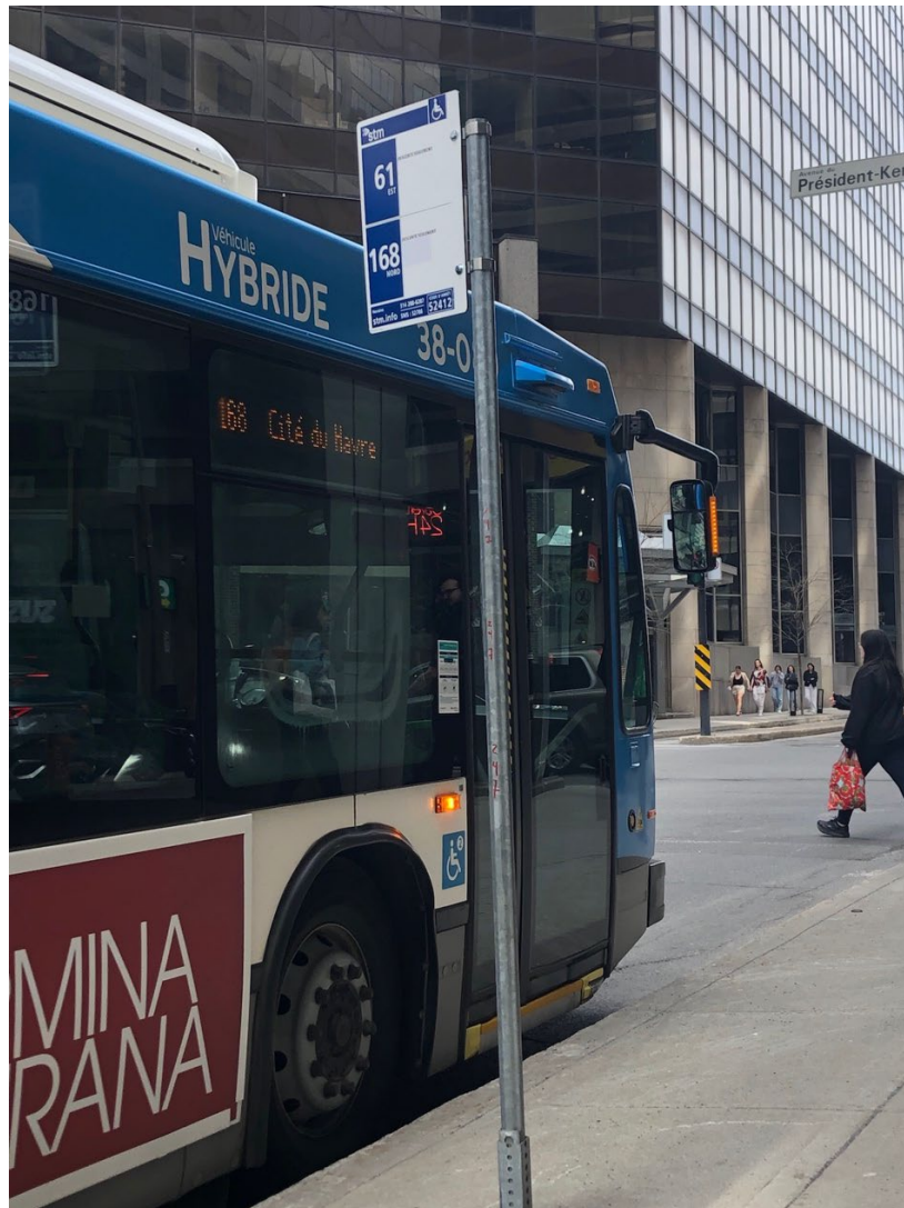
Illustration 3 - Avant d'un autobus à l'arrêt