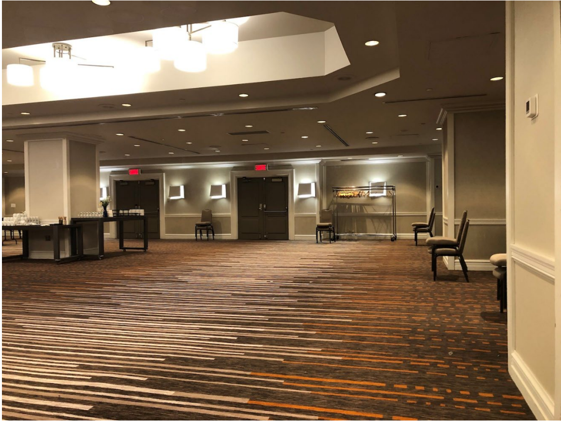
Illustration 18 - Grande salle opus 1