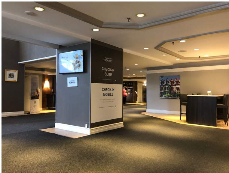
Illustration 12 - Lobby de l'hôtel

Le tapis dans l'entrée n'est pas trop épais. L'indication du comptoir d'enregistrement est claire.