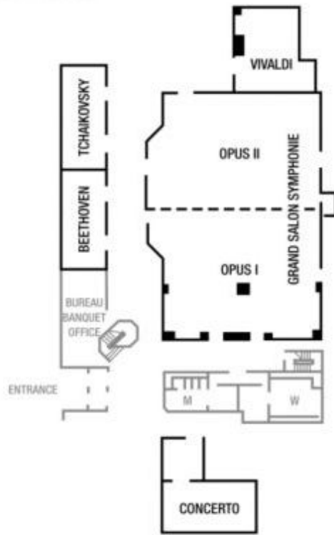
Illustration 16 - Plan des salles du niveau M (Mezzanine)