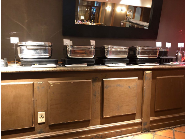
Illustration 15 - Buffet du petit déjeuner, tout est en hauteur

La même salle est également un restaurant, la salle principale est directement accessible et ne nécessite pas de changer de niveau.