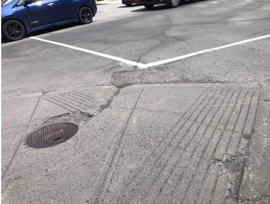
Illustration 2 - Les accès aux trottoirs sont parfois en mauvais état