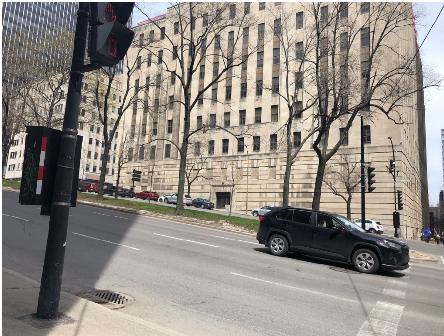
Illustration 1 - Certaines rues ont des pentes très raides

Les rues de la ville de Montréal sont très souvent en pente. Si vous êtes utilisateur d'aides à la mobilité tels qu'un fauteuil roulant manuel ou un déambulateur, il se peut que vous ayez besoin d'assistance ou de considérer des options autres que le trajet à pied. Les durées de trajet et les options sont données à titre indicatif.