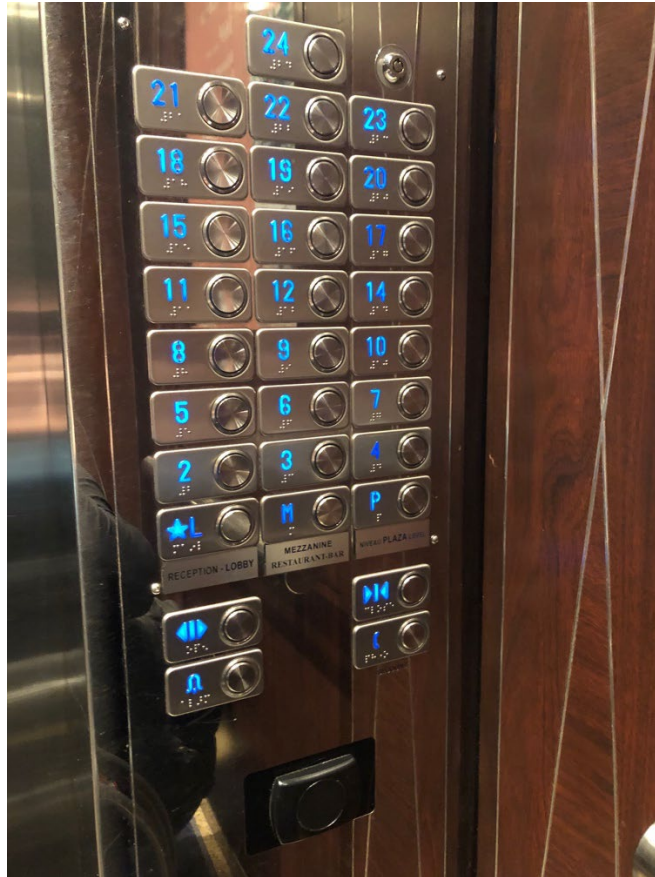
Illustration 13 - Boutons de l'ascenseur

Les boutons des ascenseurs qui montent vers les chambres et le centre de congrès sont en relief et en Braille et sont éclairés. Il faut présenter sa carte de chambre sur le lecteur à l'intérieur de l'ascenseur pour activer la sélection de l'étage. Les étages sont annoncés verbalement.