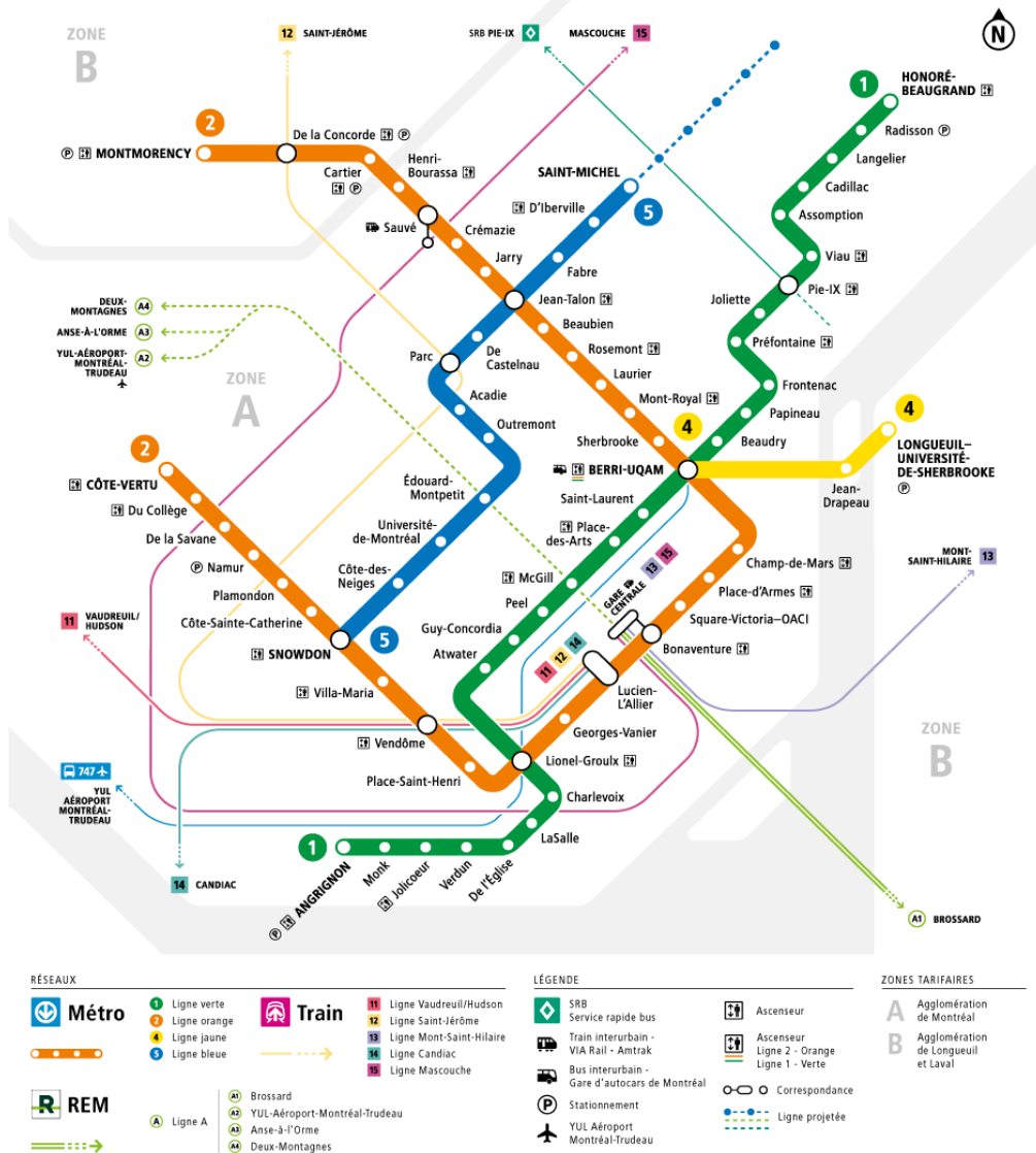
Illustration 4 - Plan du métro de Montréal

https://www.stm.info/fr/infos/etat-du-service/ascenseur