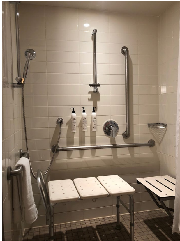
Illustration 14 - Douche adaptée dans une chambre accessible

Si vous avez réservé une chambre accessible dans l'hôtel, il est préférable de leur donner des détails sur vos besoins avant votre arrivée. Les salles de bain ont différents types d'équipement (baignoire ou douche, avec ou sans siège de transfert), certains lits peuvent être relevés, certaines chambres ont des boucles audios pour les personnes ayant une déficience auditive.