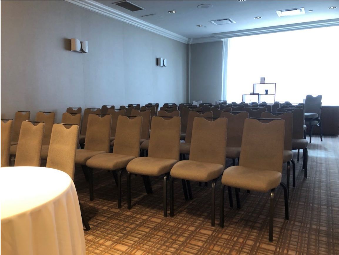
Illustration 19 - Petite salle Vivaldi avec disposition pour conférence

Il y a des prises électriques dans toutes les salles. Tous les sièges sont amovibles et peuvent être réarrangés/retirés au besoin.