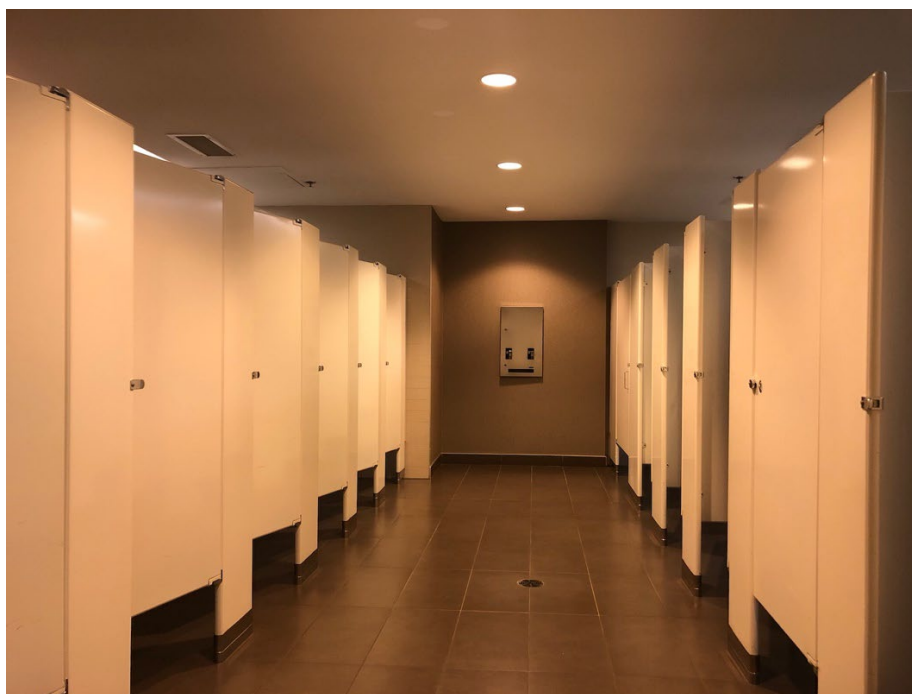
Illustration 21 - Toilettes avec plusieurs cabines

Un bouton d'ouverture de porte automatique se trouve devant chaque accès. Chaque toilette contient plusieurs cabines de toilettes, dont l'une d'elle est accessible.