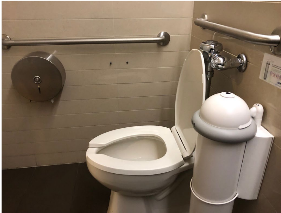
Illustration 22 - Intérieur des toilettes accessibles

Il y a des barres de transfert. La porte contient un loquet manuel et une poignée de fermeture. Il y a un porte-manteau à l'intérieur des toilettes accessibles.