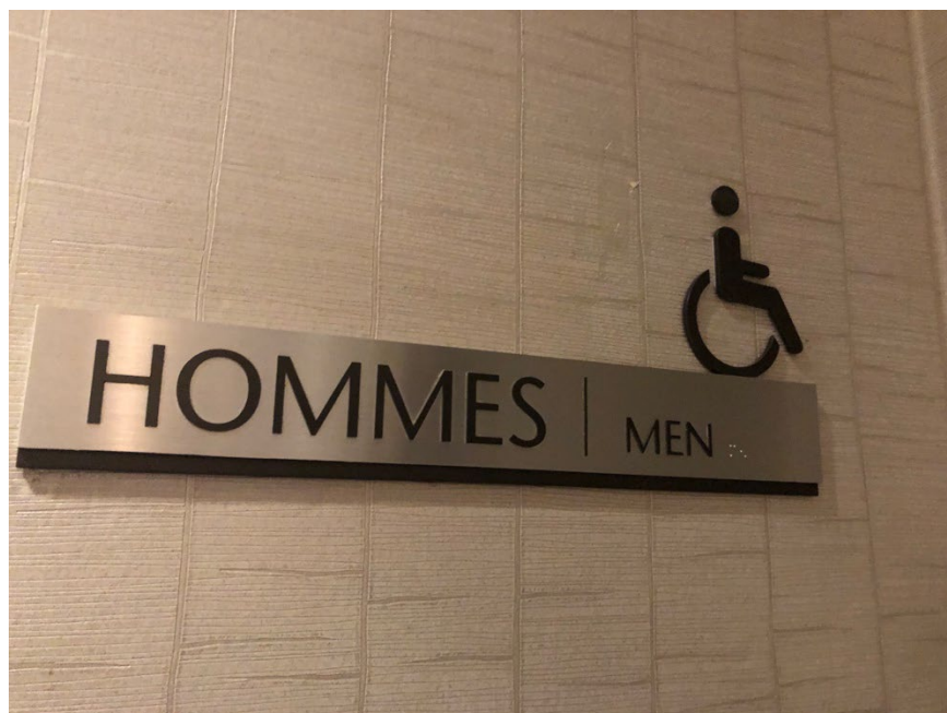
Illustration 20 - Toilettes accessibles pour hommes

Un bouton d'ouverture de porte automatique se trouve devant chaque accès. Chaque toilette contient plusieurs cabines de toilettes, dont l'une d'elle est accessible.