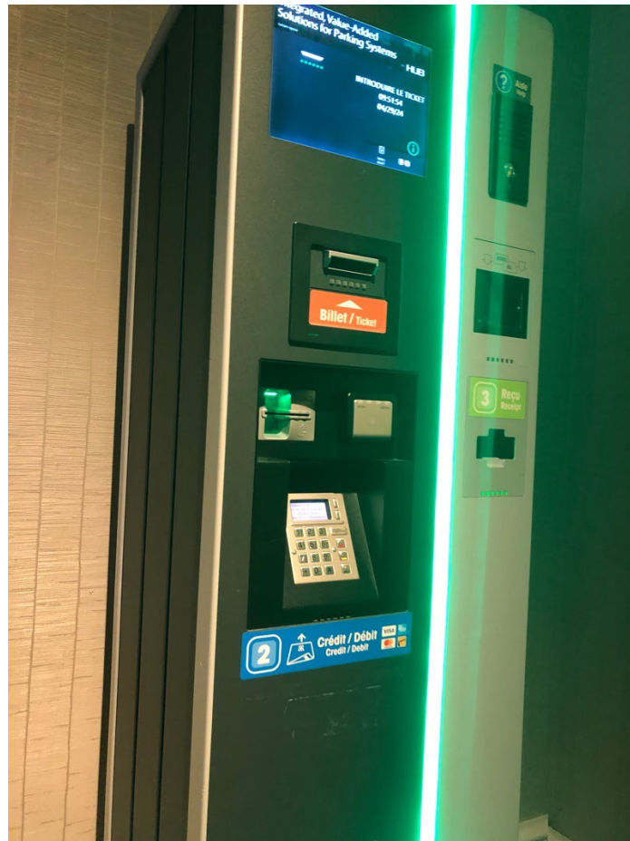
Illustration 10 - Borne de paiement parking de l'hôtel