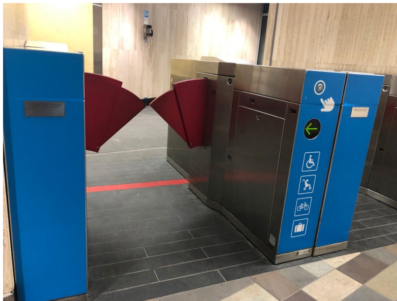
Illustration 8 - Portillon d'accès handicapé