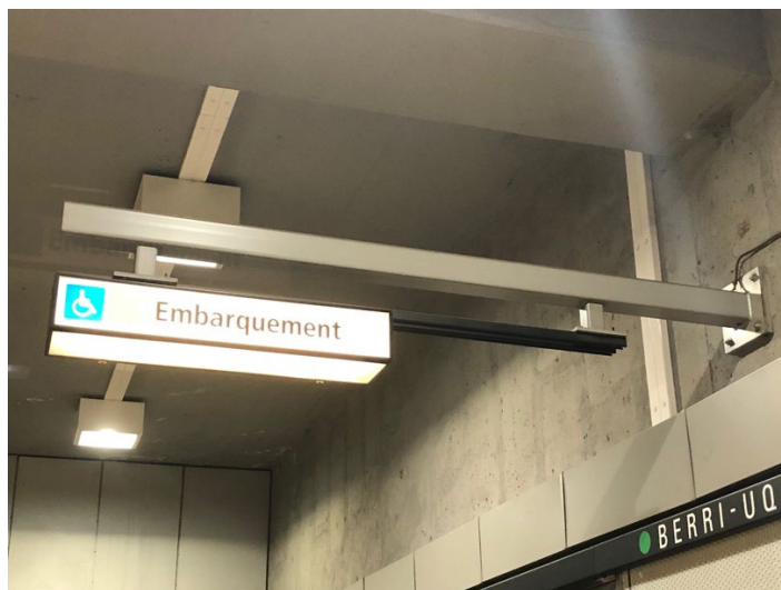
Illustration 6 - Indication embarquement, accès handicapé