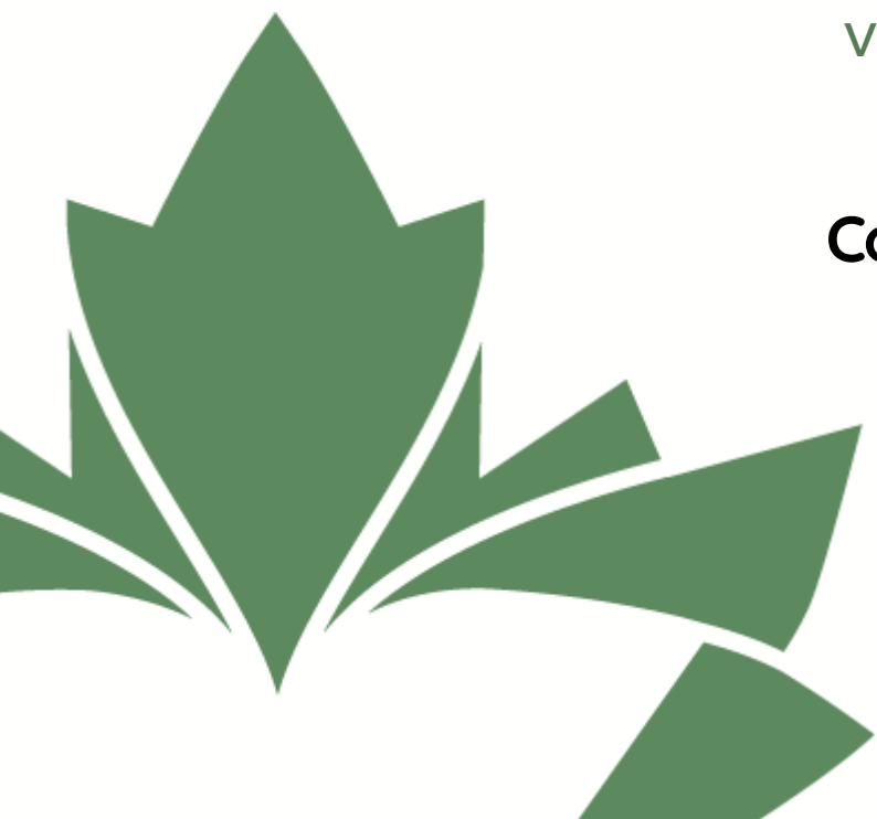
Image: PODIUM 2018 à St. John's, Terre-Neuve et Labrador.